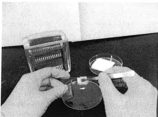
写真1 曇り止め性能試験での塗布作業

本研究開発では、多糖類、蛋白質、ミネラル、有機酸という昆布の成分を再構成するという発想に基づいて研究開発をおこなったところ、常に湿潤状態に放置されるような環境下において、十分な性能を発揮する水膜曇り止め剤が開発されることの知見を得たので報告する。